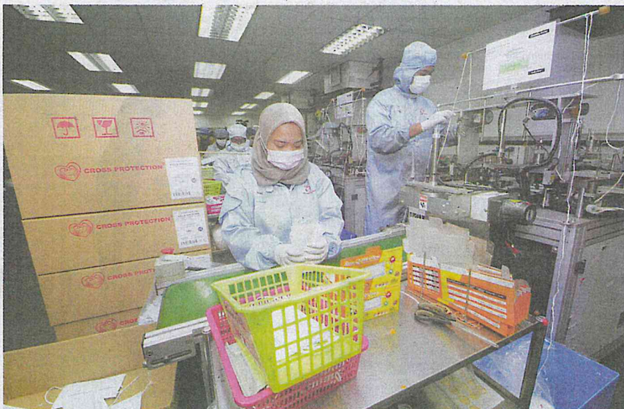
Workers packing face masks at the Cross Protection (M) Sdn Bhd factory in Meru, Klang yesterday. The plant has been instructed to boost production from 400,000 pieces to 500,000 a day to meet increased demand.

Dzulkefly said it is quite unlikely to get infected if one stays at least a metre away from an infected person. "The droplets from a cough or sneeze are the cause of transmission for the spread of the coronavirus."