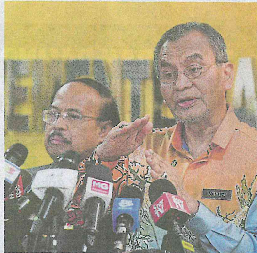
Dr Dzulkefly pada sidang media di Kementerian Kesihatan, Putrajaya, semalam.

"Wanita berkenaan tiba di negara ini bersama ibu dan tiga rakannya pada 25 Januari lalu. Mereka dilaporkan turut melawat lokasi pelancongan di sekitar Kuala Lumpur