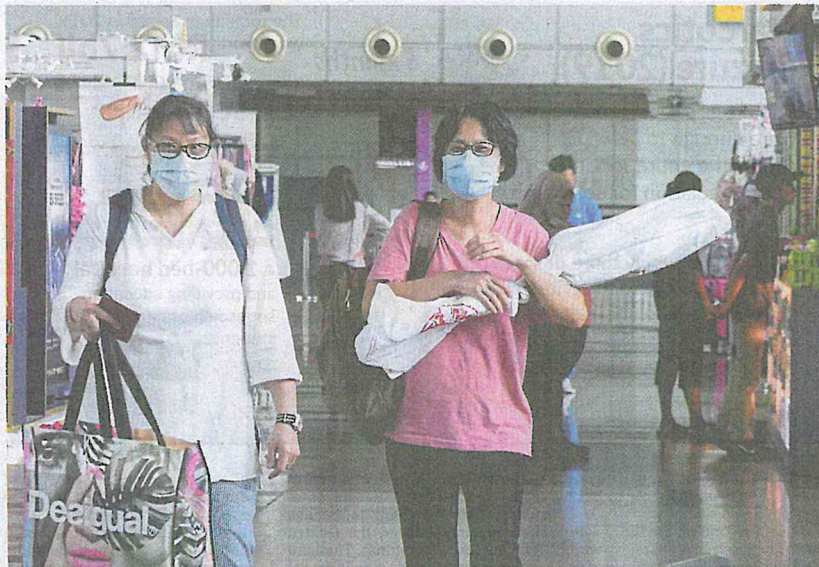
Better to be safe: Many in public are being cautious of the novel coronavirus threat and can be seen wearing face masks while going about their daily lives.

"We have already reached out to 42 individuals so far and taken sam-