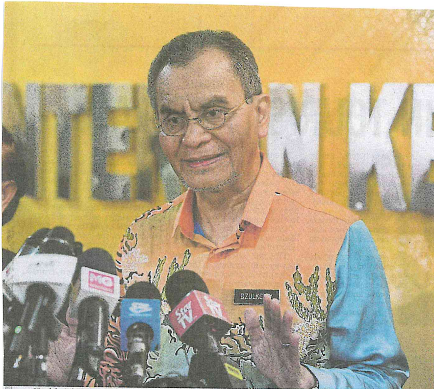
Health Minister Datuk Seri Dr Dzulkefly Ahmad (right) speaking at a press conference in Putrajaya yesterday.

Malaysia with her mother and three friends on Jan 25.